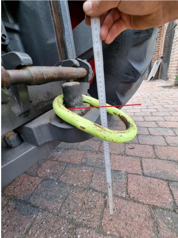
Figuur 1: Meetmethode